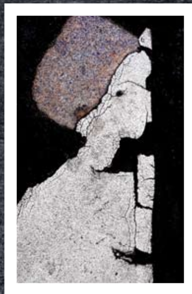
„Frau mit Hut“

Der Bamberger Fotograf Manfred Koch zeigt außergewöhnliche Aufnahmen von Pariser Zebrastrreifen