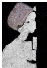
"Frau mit Hut"